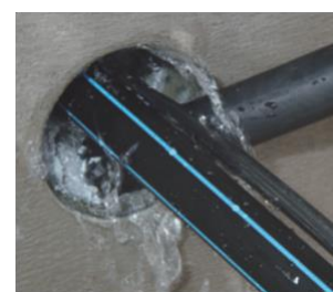
Indsprøjtning af Flex 2000