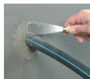
Afslutning med hurtighærdende cement