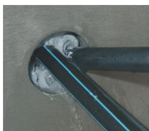
Fordel Flex 2000