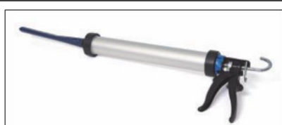
Fugepistol incl. fugespids