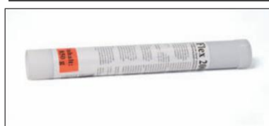
Flex 2000 tætningsmasse